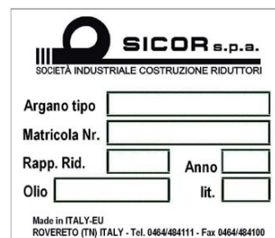
③ Табличка данных лебедки